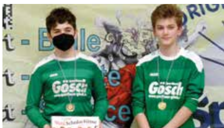
TuS 04 Bothfeld 1