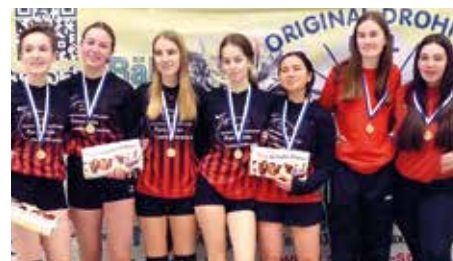
TuS Essenrode 3 - 5