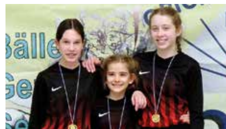
TuS Essenrode 1