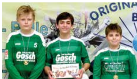
TuS 04 Bothfeld 2