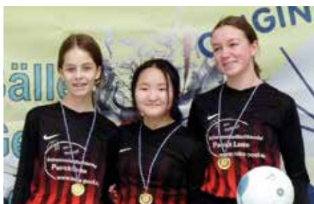
TuS Essenrode 2