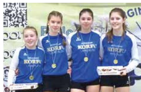
MTV Diepenau 5 + 6