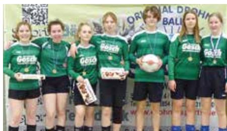
TuS 04 Bothfeld 4 - 6