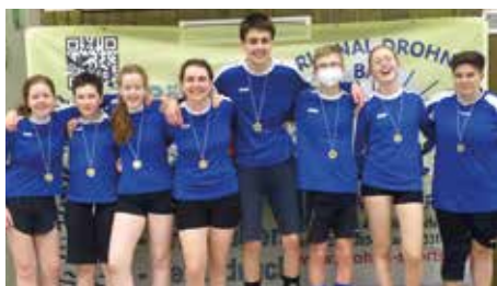
SCE Gliesmarode 2 - 4